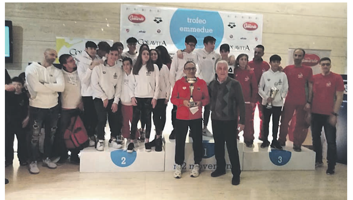
La formazione della H2O Sport A lato la gioia della Hidro Sport