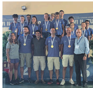
◆ Il podio della kermesse calabrese